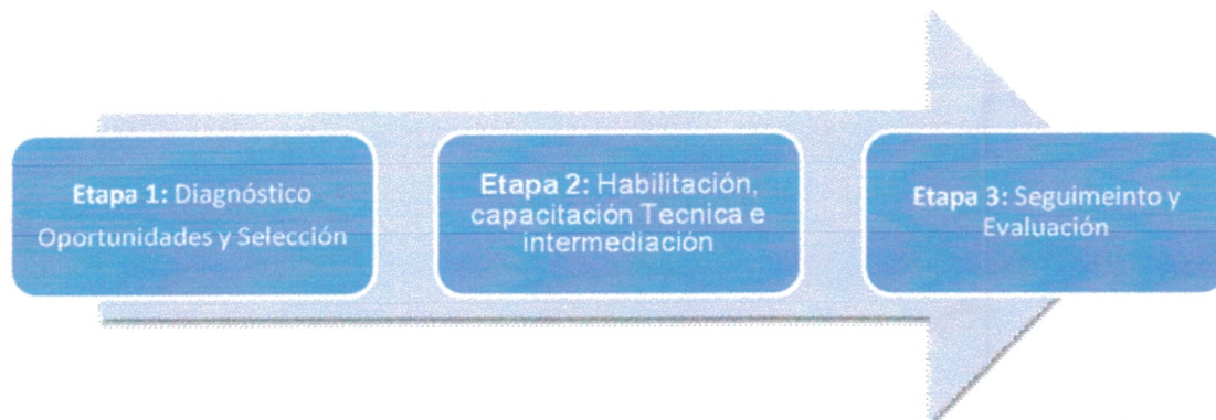
Figura Nº 1: Metodología de trabajo Programa Formativo Regular 2012

Esquemáticamente, la propuesta formativa para este programa se aprecia en la siguiente figura: