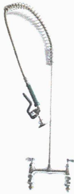
Imágen de referencia