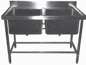
Imágen de referencia

Se detalla el uso de lavafondos de acero inoxidable (AISI 304), de una o dos cubetas según requerimiento arquitectónico, en acero inoxidable, desagüe respectivo y patas con nivelador. Debe contemplar respaldo de 10 cm. La grifería a considerar debe ser del tipo pre-wash de largo aprox. 40 pulgadas, con doble llave, doble amarre en lavafondos y en acero inoxidable Formato: