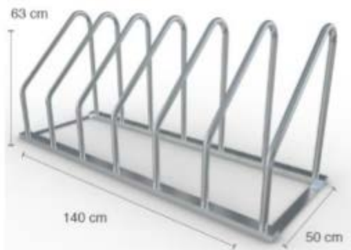
Imagen de referencia.

Materiales: Acero Inoxidable Alto: 61.5 cm Ancho: 140 cm Fondo: 50 cm Capacidad: 6 Bicicletas