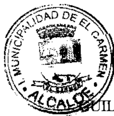
WILLERMO ALEX FERRIS FERRADA ALCALDE COMUNA EL CARMEN